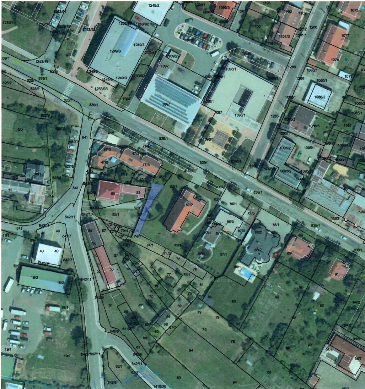
© ÚGKK SR, MPaRV SR, GKÚ, NLC Zvolen, © T-MAPY, s.r.o.