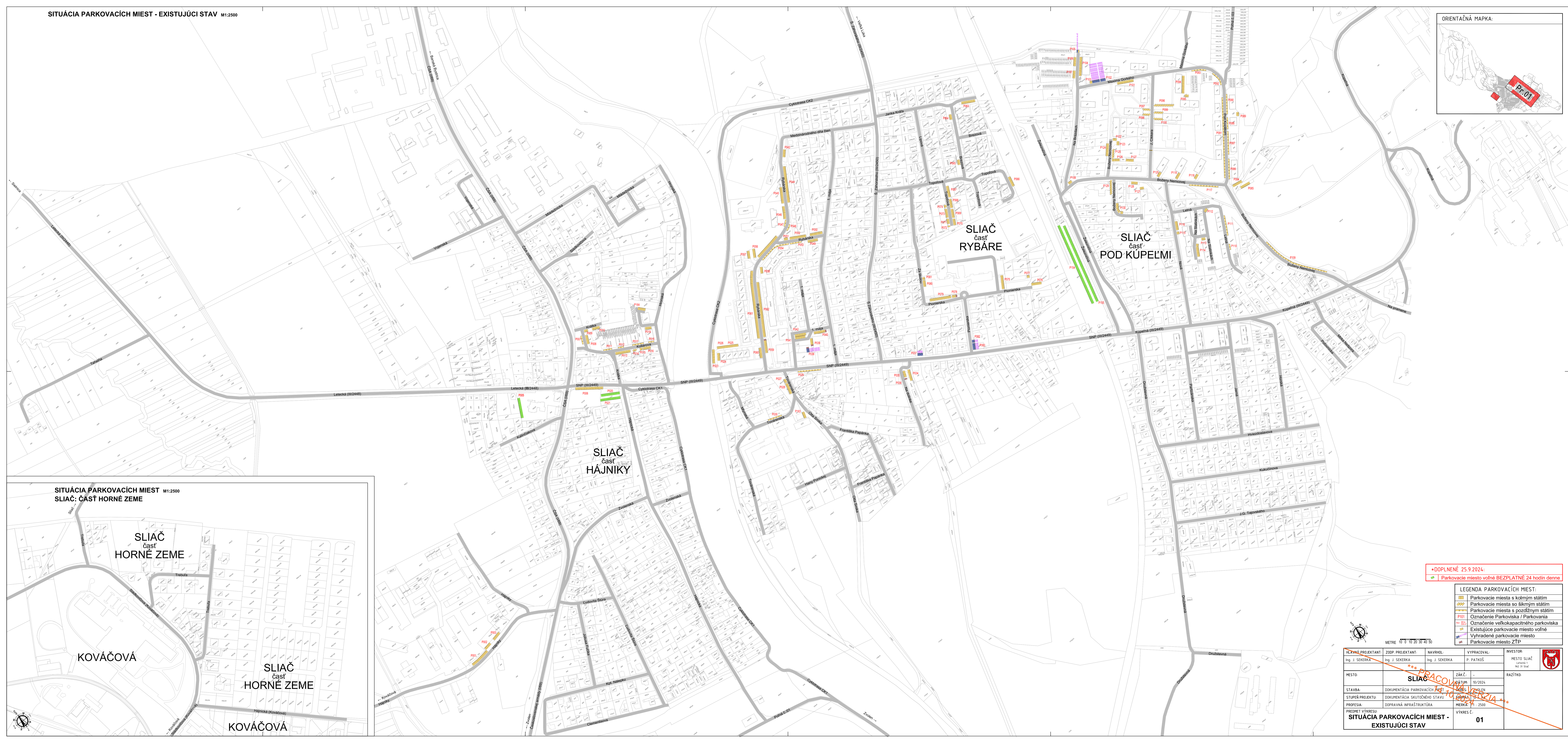
SITUÁCIA PARKOVACÍCH MIEST M1:2500 SLIAČ: ČASŤ HORNÉ ZEME